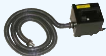
構成部品 エアーポンプ