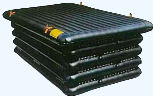
NFF28 (P150 横臥)

Firstly lay the animal, then blow up the mat with air to adjust the height.