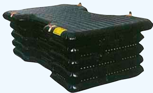
NFF29 (P255 横臥)