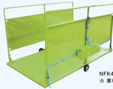
NFK45 ※ 車輪はオプションです。