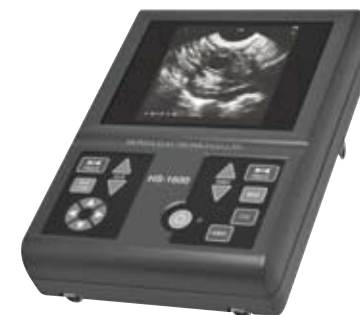
動物用超音波画像診断装置 HS-1600V (OPU)