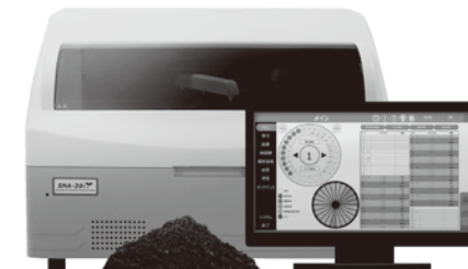
高速土壌養分自動分析装置 SNA-30i