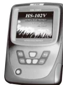
動物用超音波画像診断装置 HS-102V