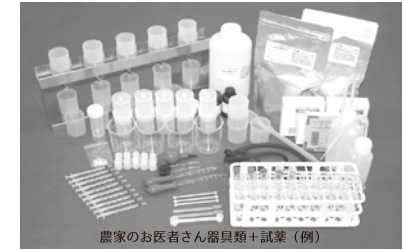
農家のお医者さん器具類+試薬(例)

日本土壤肥料学会関東支部会 日時:11月25日(土) 会場:日本大学生物資源科学部 本館中講堂(3F)